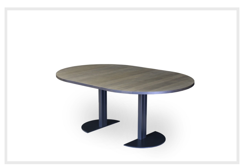
Auszugtisch mit geteilter Bodenplatte