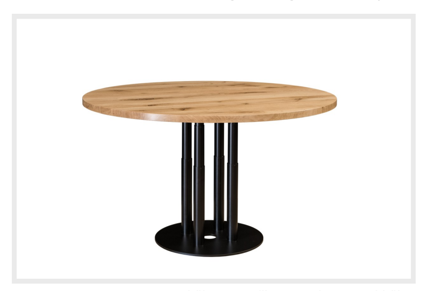
höhenverstellbar von Sitz- zu Stehhöhe