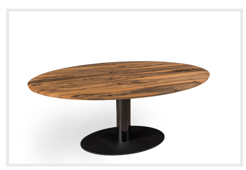
Ellipsentisch mit ellpsenförmiger Bodenplatte